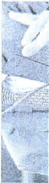
DEPUTADO Cláudio Cajado (PP-BR) é o relator do projeto do arcabouço fiscal

Uma versão preliminar circulou entre técnicos do governo no fim de semana. Por ela, se tem a pista de que Cajado também deve mexer na lista de 13