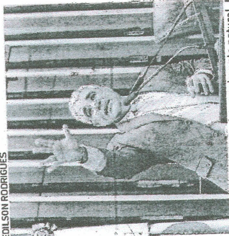
Girão faz movimento natural para as eleições 2024